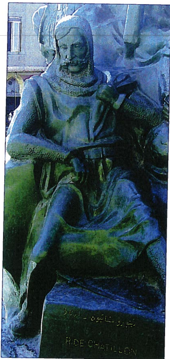
Øverst et udsnit af Saladin-statuen i Damaskus (se s. 117), der forestiller den tilfangetagne Reynald de Châtillon efter slaget ved Hattin i 1187. Reynald var én af Saladins argeste fjender, og den besejrede Reynald, der ydmygt kigger ned forstærker statuens sejrssymbolik. Til højre et korsfarersværd, der kom i arabisk besiddelse efter et slag i Alexandria i 1365, og som efterfølgende blev forsynet med arabiske indskrifter og ophængt som trofæ i Alexandrias arsenal sammen med en række andre europæiske våben. Fra Davids Samling, inv.nr. 1/1998.